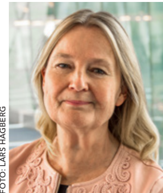
Marita Ulvskog Ordförande