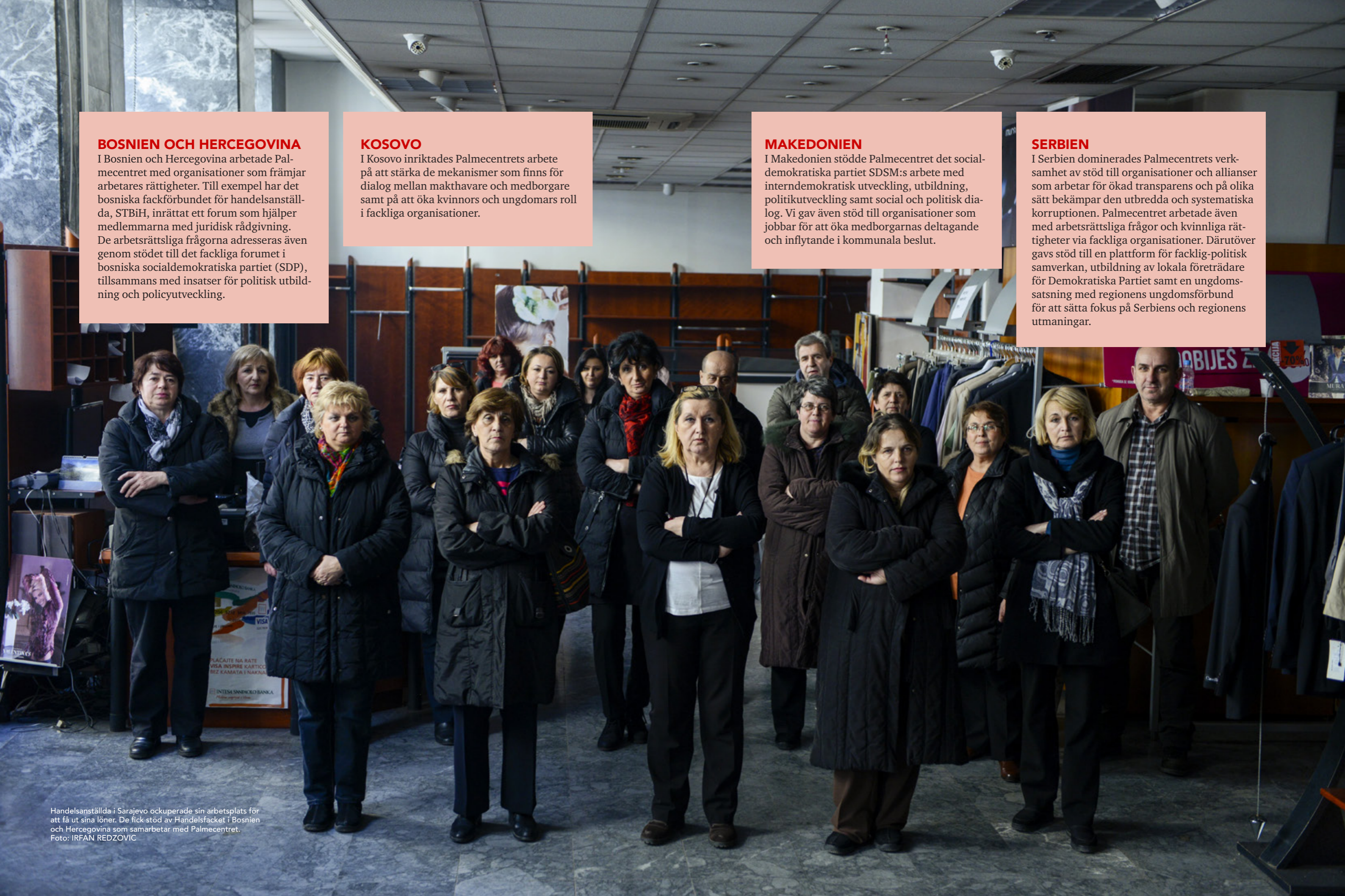
Handelsanställda i Sarajevo ockuperade sin arbetsplats för att få ut sina löner. De fick stöd av Handelsfacket i Bosnien och Hercegovina som samarbetar med Palmecentret.

I Serbien dominerades Palmecentrets verksamhet av stöd till organisationer och allianser som arbetar för ökad transparens och på olika sätt bekämpar den utbredda och systematiska korruptionen. Palmecentret arbetade även med arbetsrättsliga frågor och kvinnliga rättigheter via fackliga organisationer. Därutöver gavs stöd till en plattform för facklig-politisk samverkan, utbildning av lokala företrädare för Demokratiska Partiet samt en ungdomsatsning med regionens ungdomsförbund för att sätta fokus på Serbiens och regionens utmaningar.