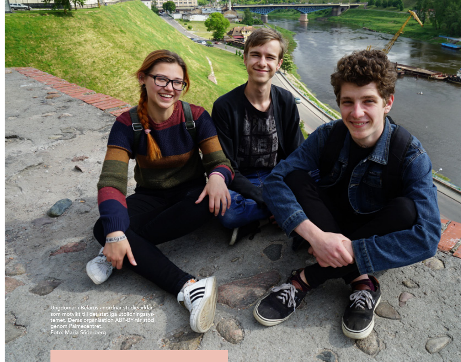
Ungdomar i Belarus anordnar studiecirklar som motvikt till det statliga utbildningssystemet. Deras organisation ABF-BY får stöd genom Palmecentret.

Vissa av Palmecentrets samarbeten med partners i olika länder är sekretessbelagda av hänsyn till de medverkandes säkerhet.