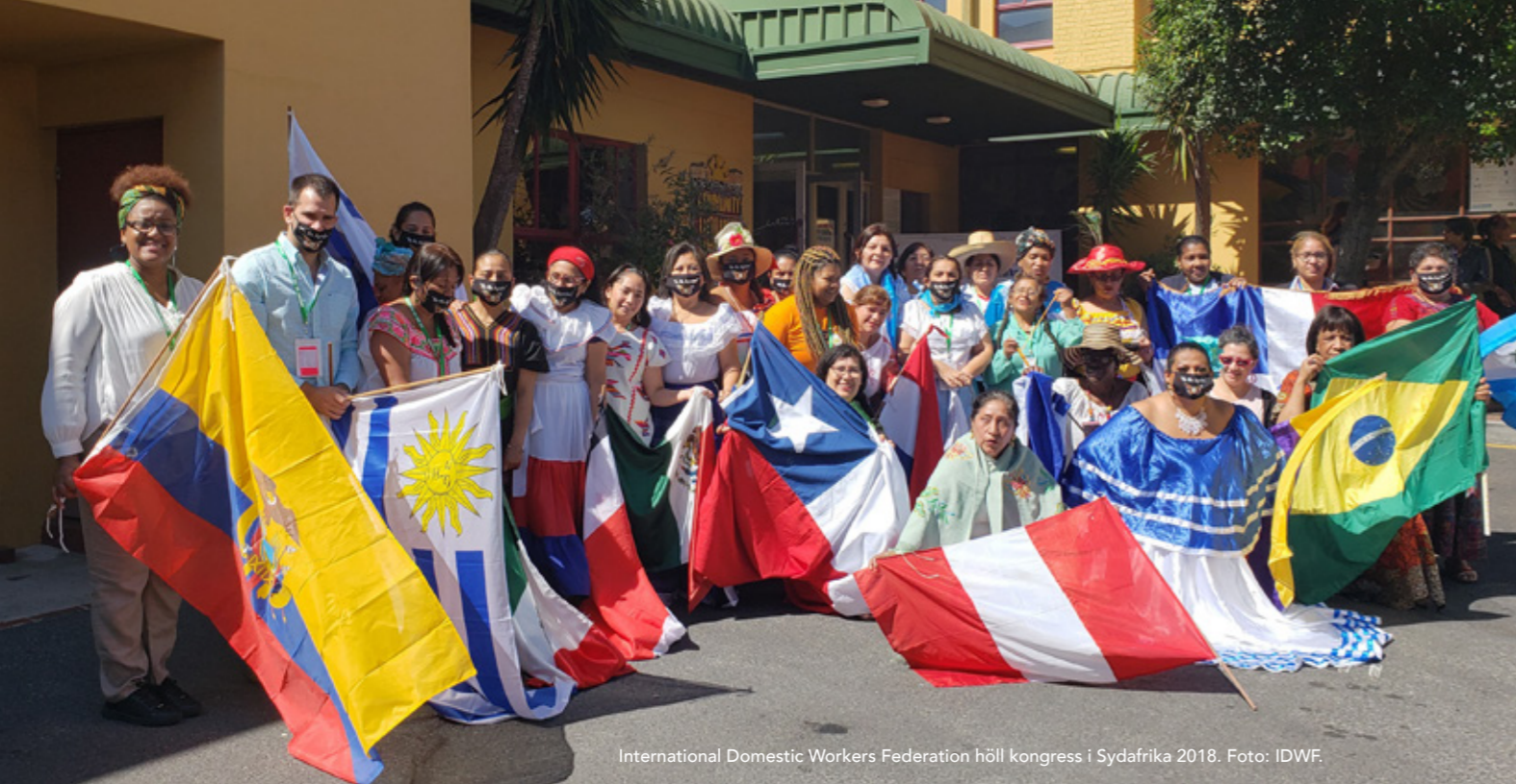
International Domestic Workers Federation höll kongress i Sydafrika 2018.