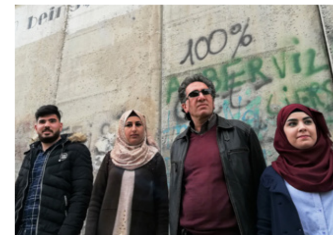
Underst: I Zimbabwe stödjer Palmecentret teatergruppen Patsime Trust som genom rollspel och teater ökar medvetenheten om jämställdhet i arbetslivet.