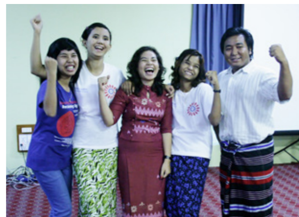
Samarbetspartners från Burma, organisationen YCOWA, hjälper arbetare att ta strid mot hänsynslösa arbetsgivare.