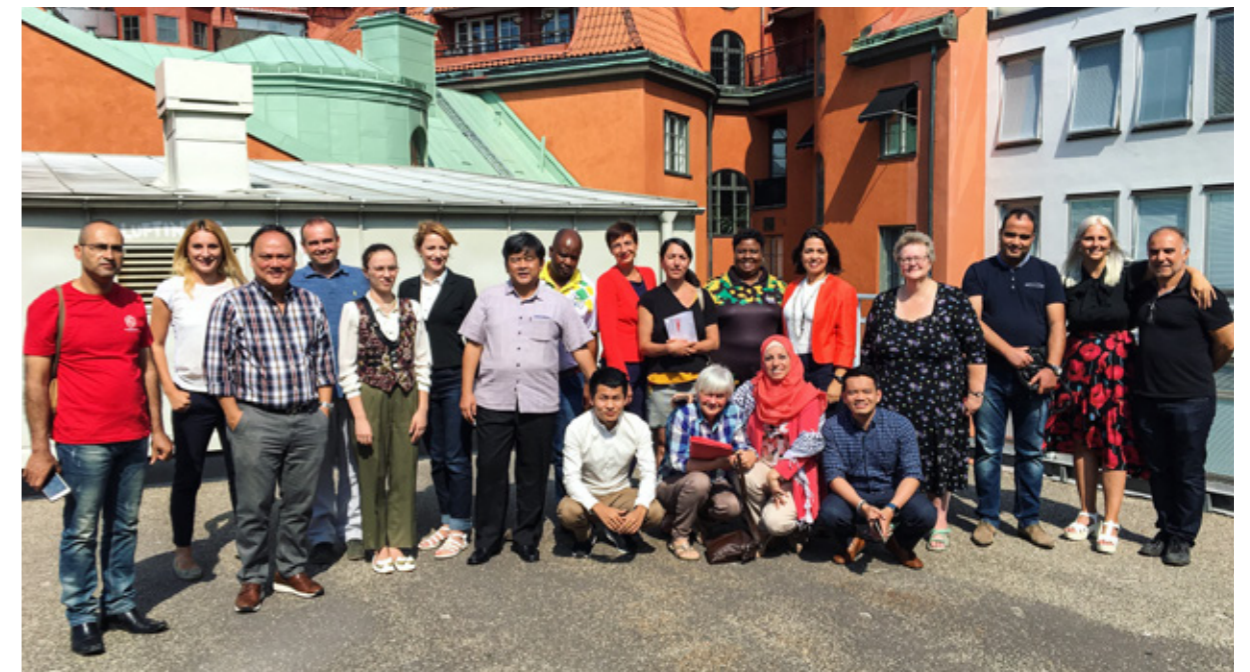
Palmecentret och Socialdemokraterna anordnade ett valseminarium i Stockholm i augusti för systerpartier från olika delar av världen.

I juli deltog Palmecentret i Almedalsveckan på Gotland tillsammans med två gäster från systerpartiet i Makedonien – Makedoniens Socialdemokratiska Union (SDSM). Under veckan deltog Palmecentret och representanterna från SDSM i olika seminarier och möten som anordnades med framträdande politiker inom Socialdemokraterna.