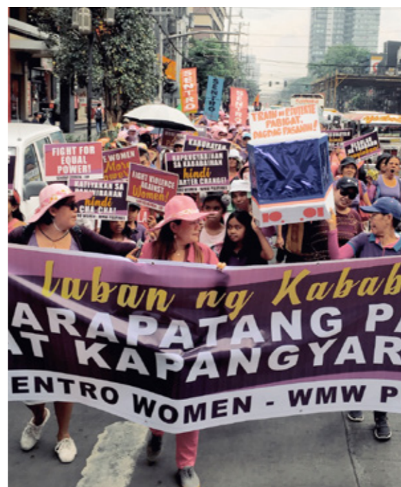
Demonstration med Sentro Women i Manila.