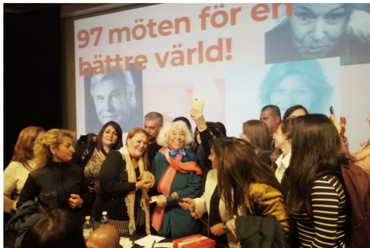
Nawal El Saadawi mötte många beundrare när hon besökte Folkets Hus i Hammarkullen.

Utöver programmen på Bokmässan arrangerades tillsammans med ABF Göteborg ett välbesökt scenprogram på arabiska i Folkets Hus Hammarkullen med författaren Nawal El Saadawi.