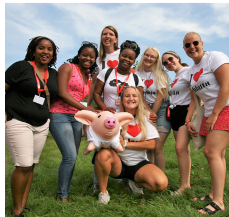
Deltagare i SSU:s valläger i augusti 2018.