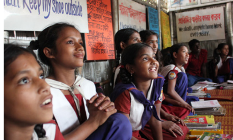
Palmecentret stödjer Children on the Edge som byggt trygga platser för barn i folkgruppen rohingya som flytt från Burma till Bangladesh.