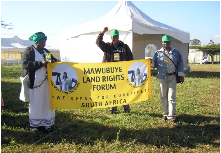
Rätten till land är en viktig fråga för många minoritetsgrupper. Protester vid World Social Forum i Nairobi 2007.

mindre ockuperade de lukrativa odlingsmarker som fram till dess bebotts av minoriteter.