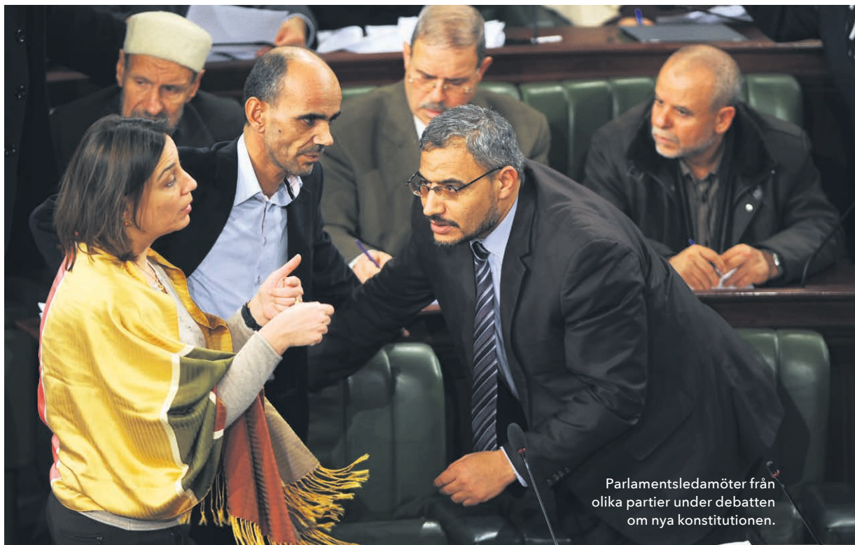
Parlamentsledamöter från olika partier under debatten om nya konstitutionen.

i det arbetet och att vi faktiskt skulle lyckas.