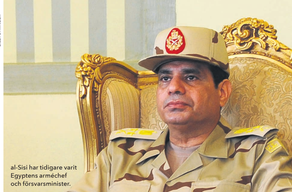
al-Sisi har tidigare varit Egyptens arméchef och försvarsminister.