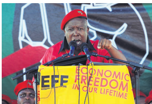
Julius Malema har vunnit stöd bland annat genom att förespråka ett förstatligande av gruvindustrin.

Trotsigt reser sig sju pelare mot skyn – en symbol för det nya Sydafrikas konstitution, kallad den mest demokratiska i världen, och