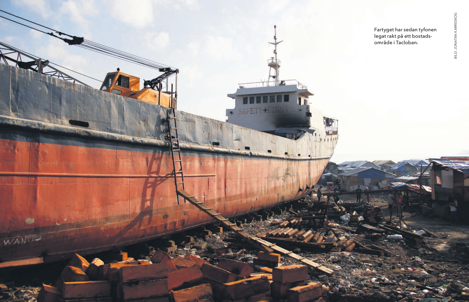
Fartyget har sedan tyfonen legat rakt på ett bostadsområde i Tacloban.