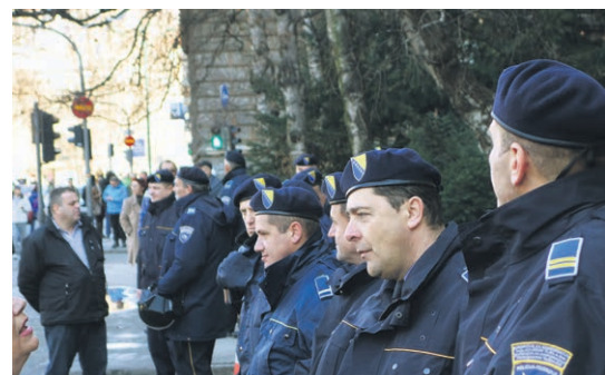
Missnöjet med politikerna är stort i Bosnien och Hercegovina, här vid en demonstration i Sarajevo i februari 2014.