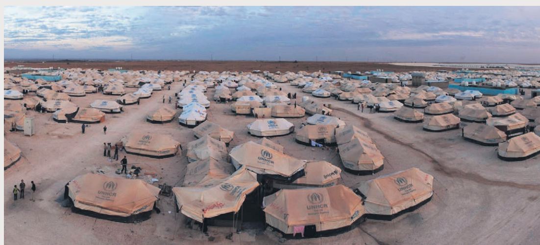
Flyktinglägret Zaatari i november 2012.

I gränsområdena mot Syrien har huspriserna ökat, i skolorna hålls undervisningen i dubbla skift och på sina håll har avloppssystemen kollapsat på grund av överbelast-