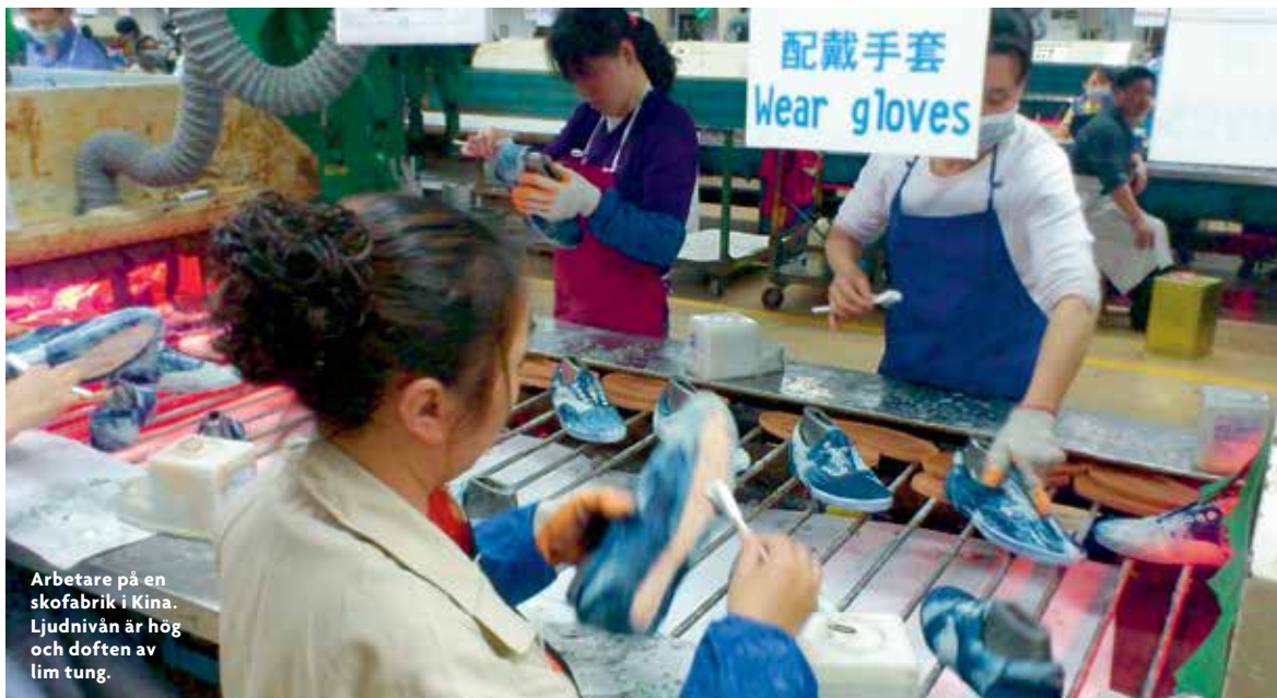
Arbetare på en skofabrik i Kina. Ljudnivån är hög och doften av lim tung.