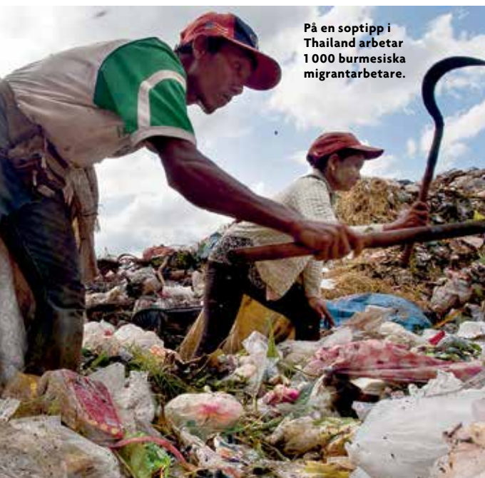
På en soptipp i Thailand arbetar 1 000 burmesiska migrantarbetare.

Vill du göra en insats? Skaffa kunskaper och engagera dig för att fackföreningar, politiska partier, näringsliv och myndigheter – i Sverige och internationellt – ska arbeta för att förhindra att människor blir offer för slaveri.