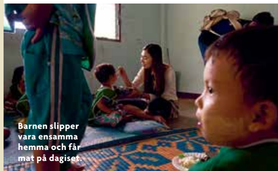
Barnen slipper vara ensamma hemma och får mat på dagiset.

YCOWA har ett dagis för barn till migrantarbetare som behöver lämna barnen ensamma när de arbetar hela dagarna. Det har förekommit misshandel och våldtäkter på minderåriga barn som lämnats hemma, så YCOWA valde att starta dagiset för att kunna ta hand om dem. Det är också en träffpunkt för föräldrar där de kan informera om mänskliga rättigheter och arbetsrätt.