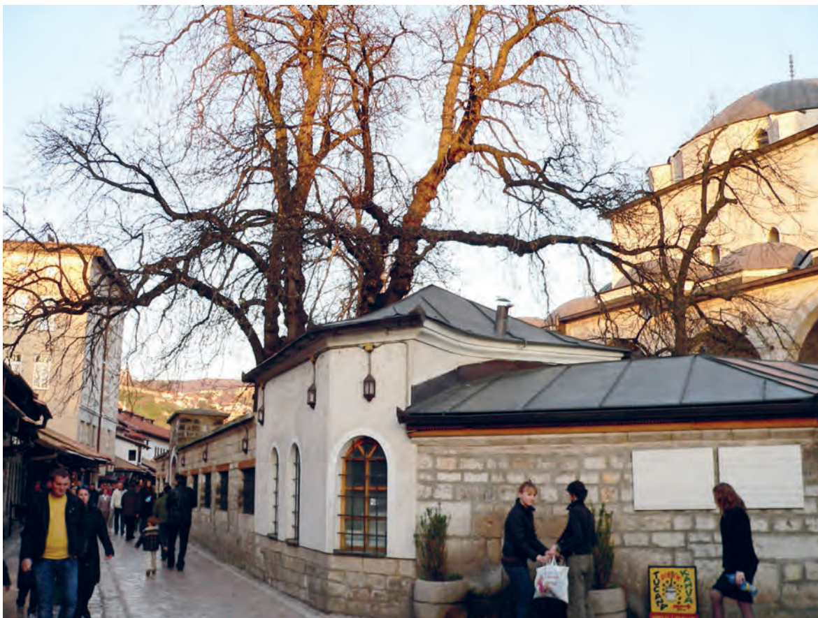
Sarajevo är en multikulturell stad där många olika människor, religioner och kulturer blandas.

met och det är viktigt att det tas krafttag av politikerna för annars kommer unga att tvingas lämna landet menar hon. Detta är redan nu ett stort problem och det lär inte bli bättre om inget görs.